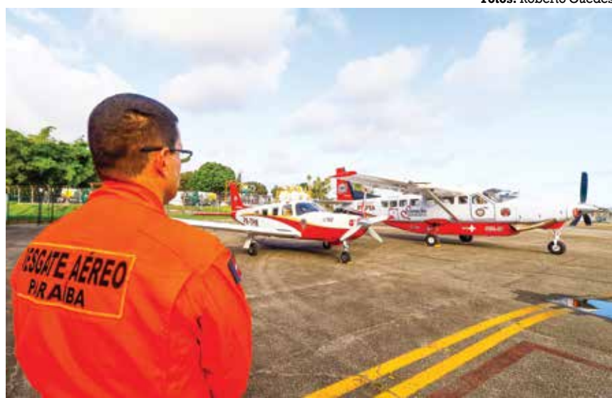
O resgate aéreo da Paraíba foi reforçado para o transporte de pessoas e órgãos