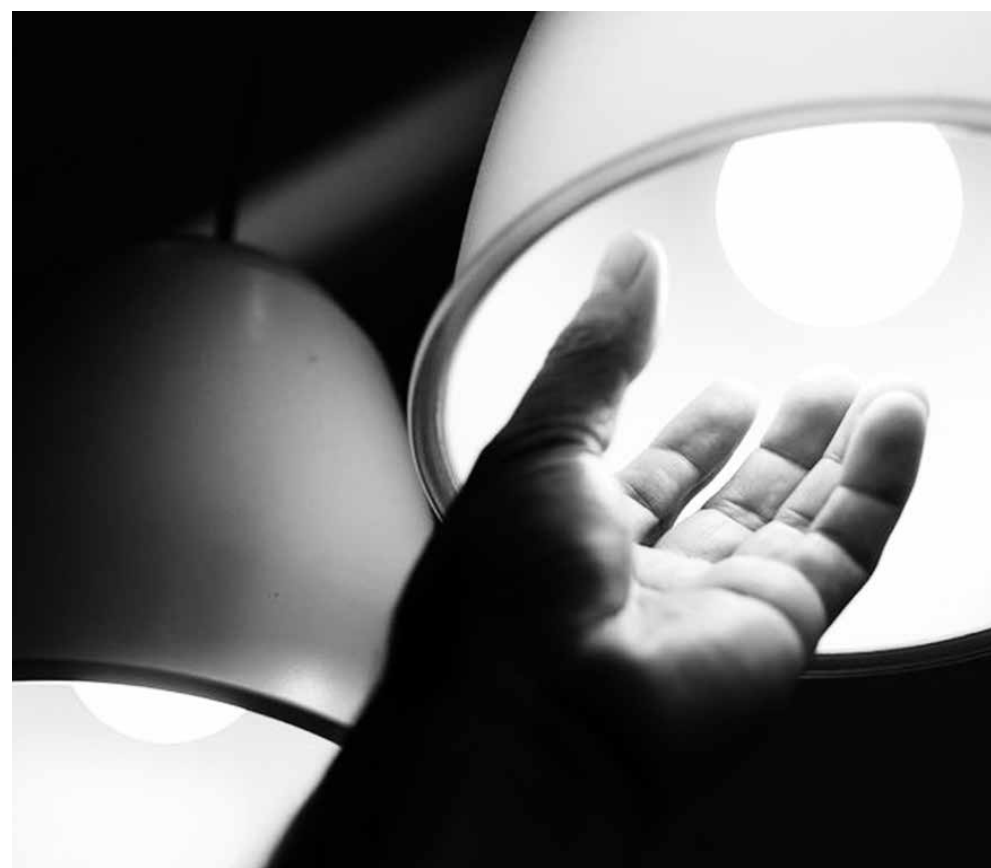
Segundo Aneel, manutenção da bandeira verde reflete condições favoráveis de geração de energia

A bandeira verde, quando não há cobrança adicional, significa que o custo para produzir energia está baixo. Já as bandeiras amarela e vermelha 1 e 2 representam um aumento no custo da geração e a necessidade de acionamento de térmicas, o que está relacionado principalmente ao volume dos reservatórios.