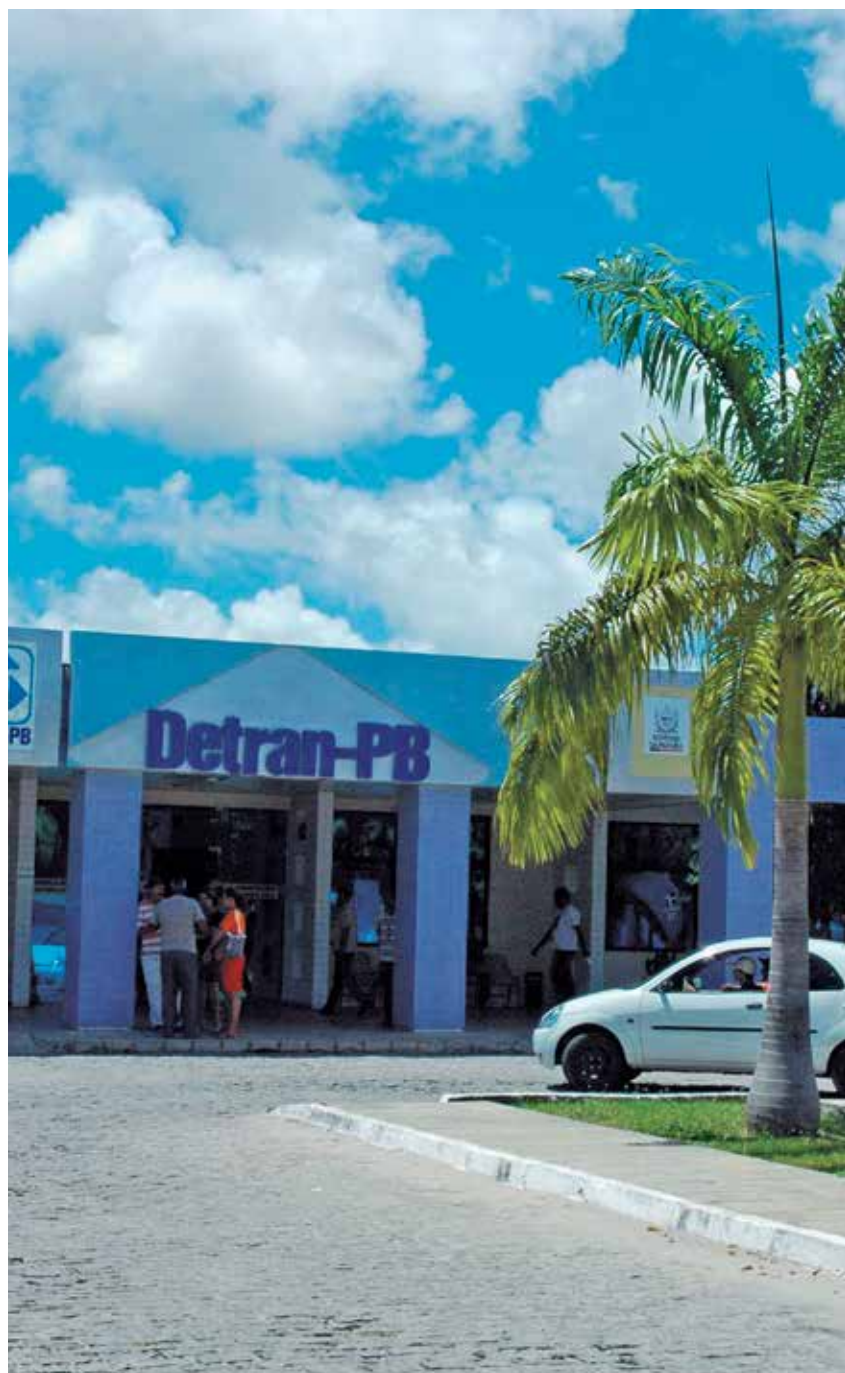
Leilão do Detran disponibilizará mais de 1.800 lotes de veículos

Leilão Para participar do leilão de forma on-line basta acessar o site indicado, realizar o cadastro e ofertar os lances pela internet , acompanhando os lances de terceiros