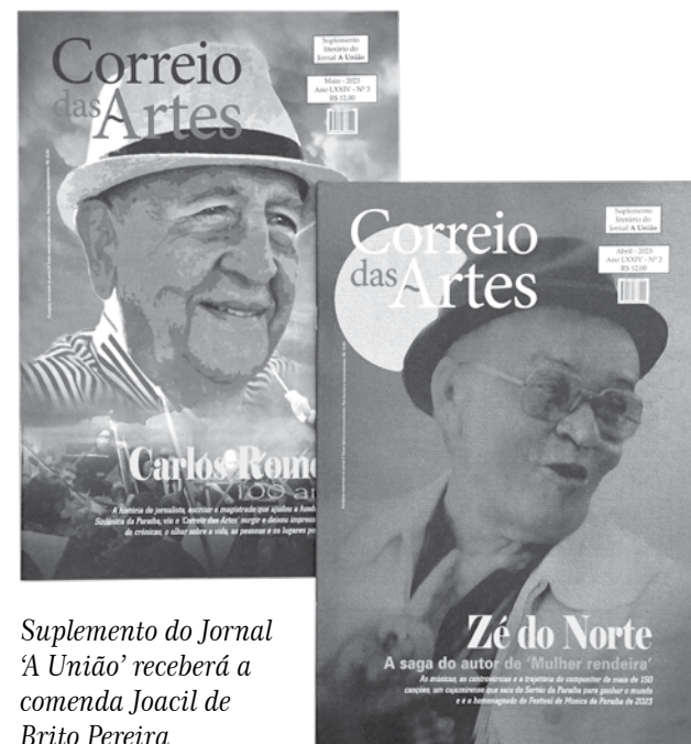
Suplemento do Jornal 'A União' receberá a comenda Joacil de Brito Pereira