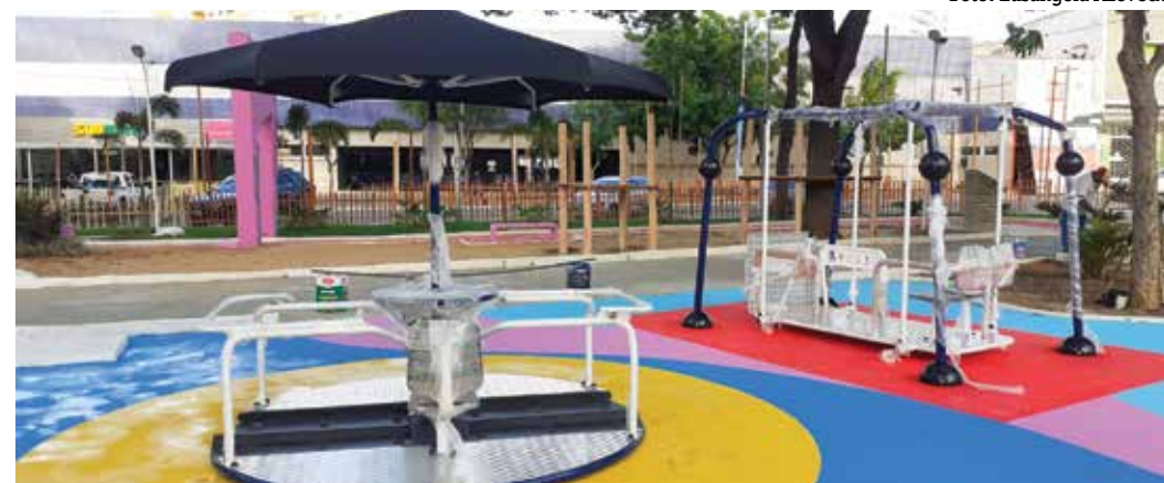
Brinquedos foram pensados para atender à população com deficiências e mobilidade reduzida