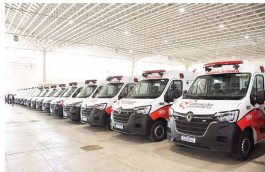
Ambulâncias vão modernizar o atendimento dos serviços de saúde na PB