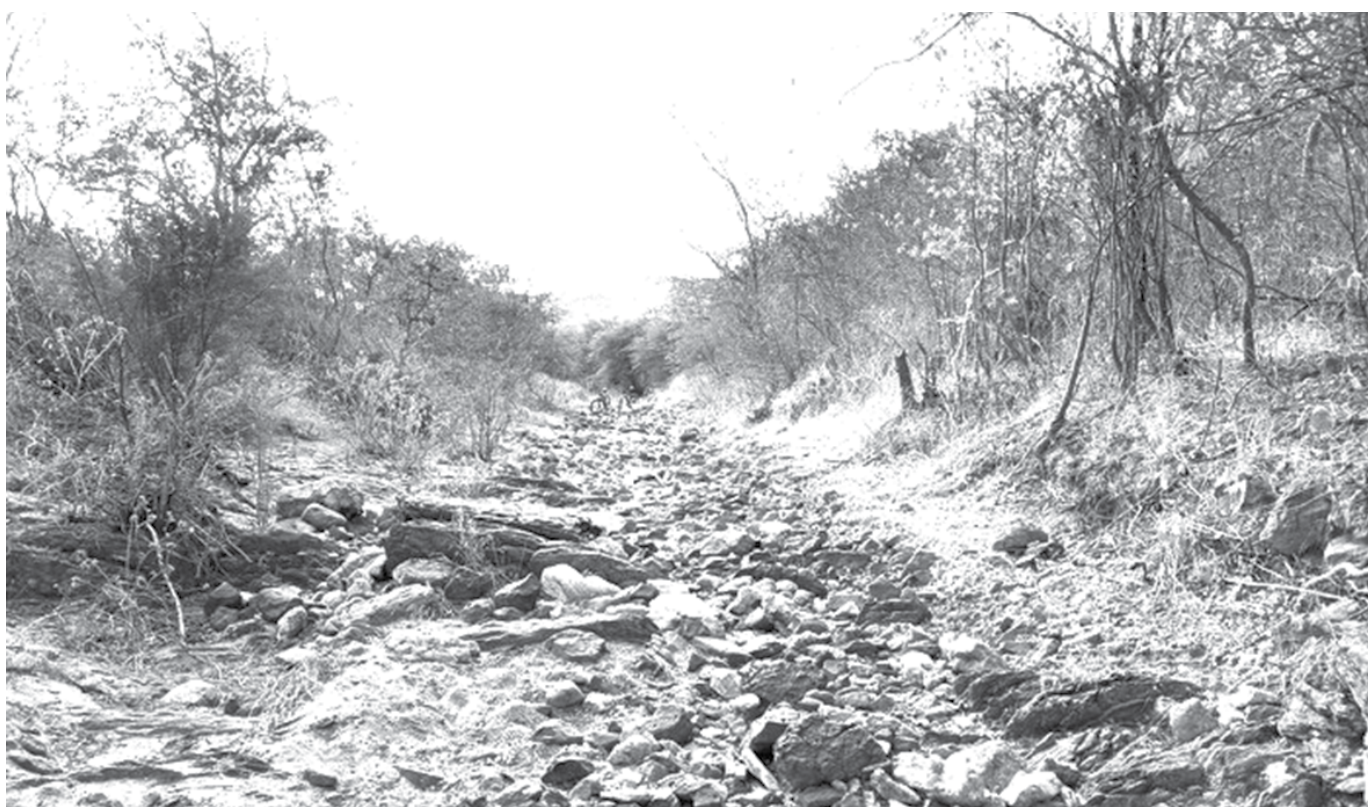
Devido ao grau de dificuldade da trilha, os participantes devem levar água, chapéu ou boné e usar calçados apropriados