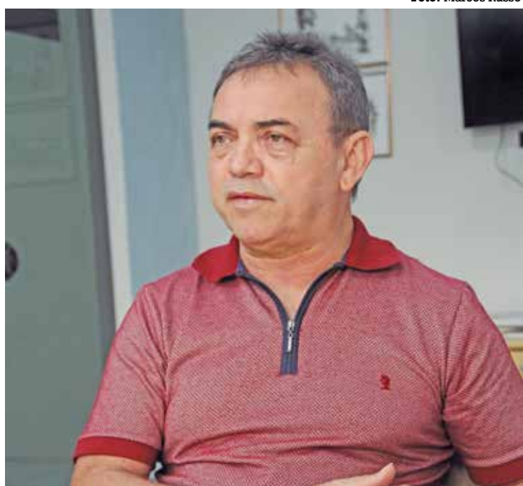
Rangel Júnior é presidente da Fundação de Apoio à Pesquisa do Estado