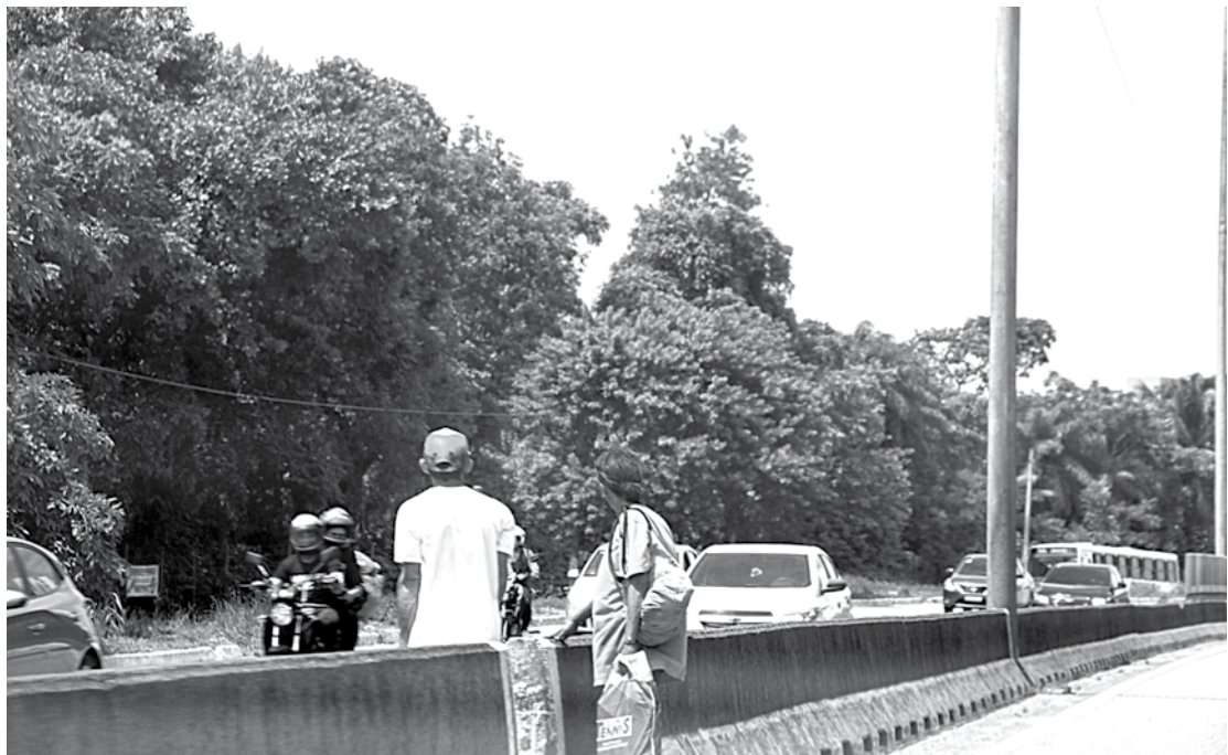
Ignorando o perigo