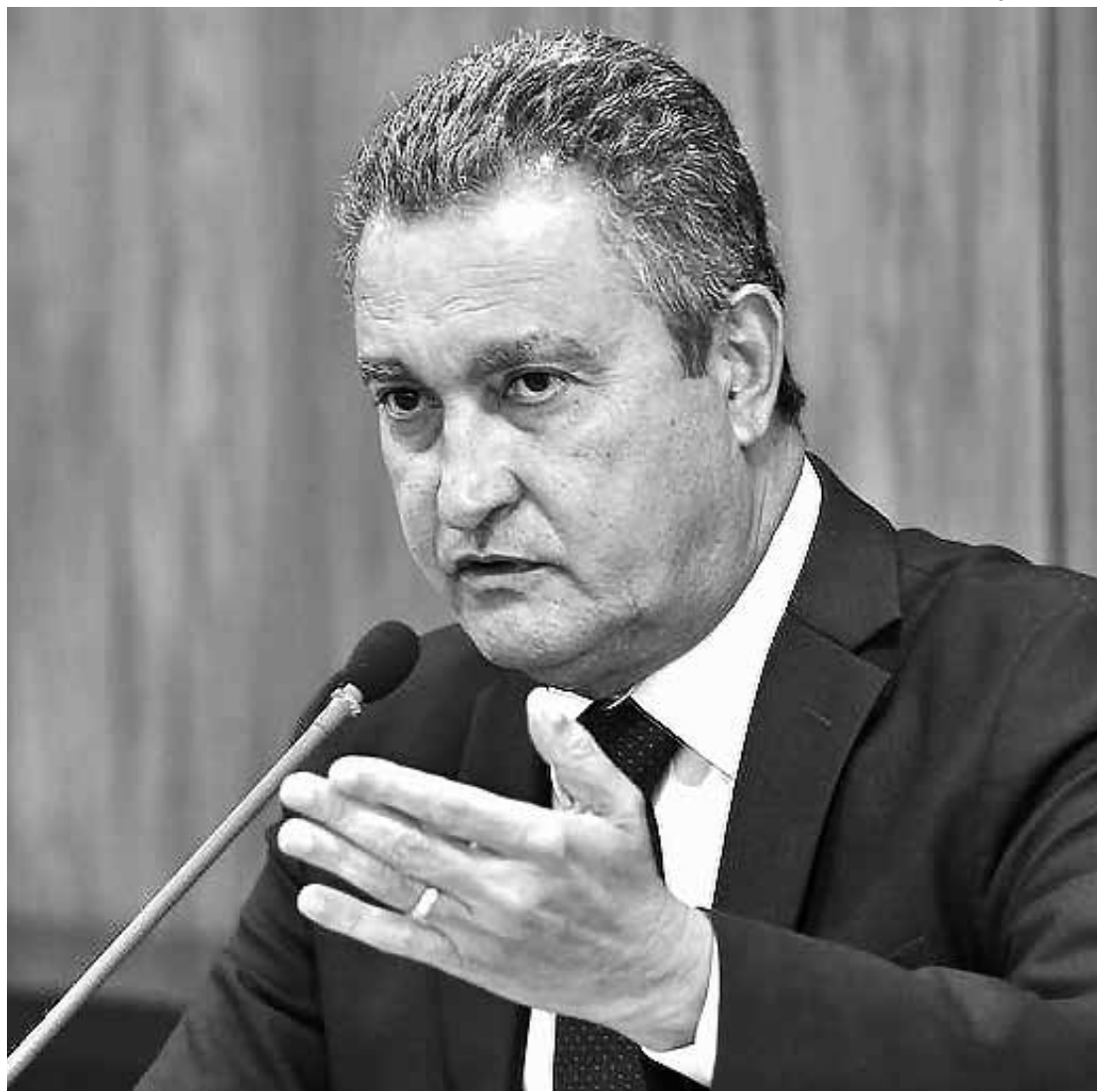
O ministro da Casa Civil, Rui Costa, afirmou que o governo trabalha para reverter a situação no Congresso

A suspensão, se aprovada pelo plenário, valerá até o julgamento definitivo do RE 1387795.