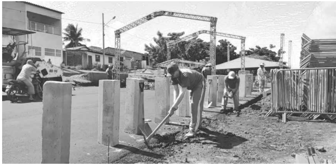
Além de estradas, o distrito também recebe reparos nas estruturas do Pavilhão do Forró e ruas