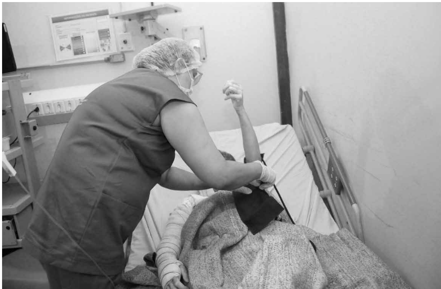
Profissionais de saúde detalham orientações para evitar queimaduras com fogos, fogueiras e comidas típicas do período junino

A iniciativa faz um alerta sobre os acidentes com fogos de artifício no período junino. Segundo o diretor-geral da instituição, Laécio Bragante, cerca de 30% dos atendimentos da UTQ