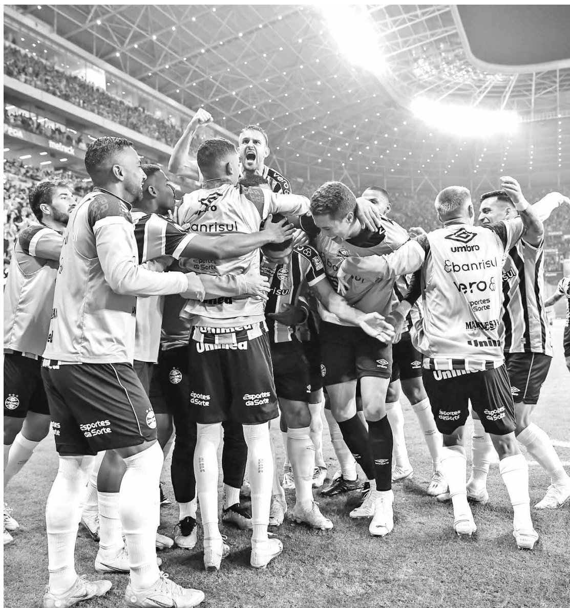
O Grêmio, que faz uma campanha regular, vai até a Arena da Baixada enfrentar o Athletico-PR